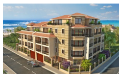
VILLA KASTORIA, Ravda