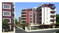
MELIA 2, Ravda