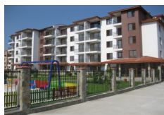
APOLLON 7, Ravda