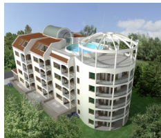
Vista Del Mar, Ravda