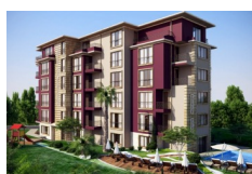
MELIA 3, Ravda