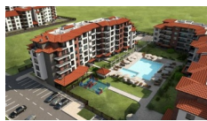
Apollon 8, Ravda