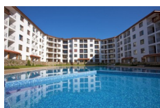
APOLLON 6, Ravda