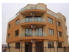
Amadeus XVII, Ravda