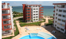
Riviera Fort Beach, Ravda