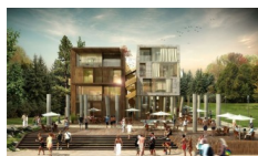
AMARA BOUTIQUE, Ravda