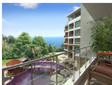
Golden Amos, Złote Piaski