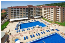
BENDITA MARE, Złote Piaski